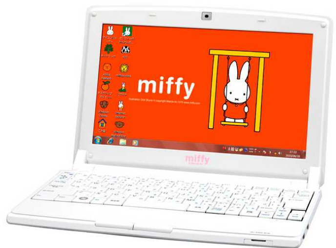
パソコンデザインイメージ

Illustrations Dick Bruna (C) copyright Mercis bv,1953-2010 www.miffy.com