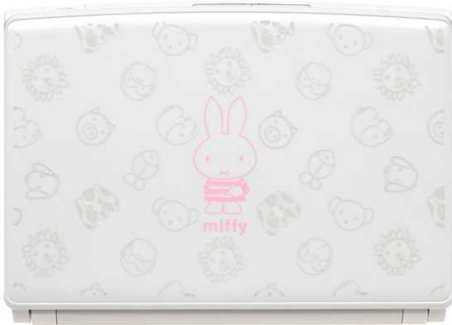
背面デザインイメージ

株式会社バンダイナムコゲームス(代表取締役:石川祝男、本社:東京都品川区)と、株式会社ディック・ブルーナ・ジャパン(代表取締役:鐵田昭吾、本社:東京都港区)は、お子さまから大人まで幅広い層に人気の絵本の主人公『ミッフィー』の誕生 55 周年を記念したオリジナル製品「ミッフィー モバイルノートパソコン」を発売します。バンダイナムコゲームスの運営するキャラクター製品通信販売サイト「LaLaBit Market(ララビットマーケット)」にて2010年7月9日(金)12時から予約受注を開始します。